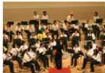
吹奏楽部定期演奏会