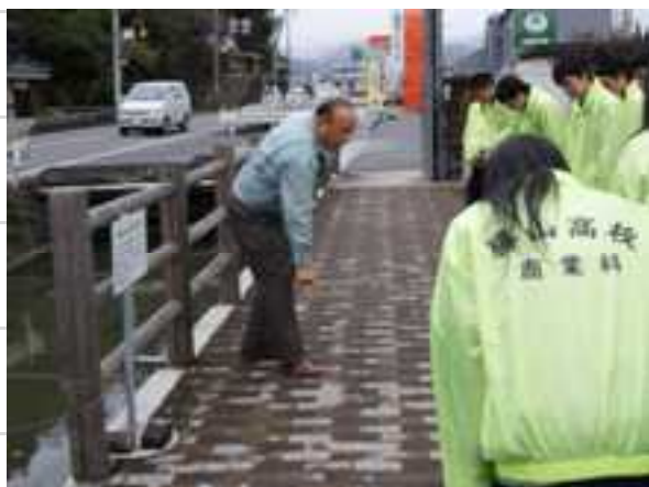
地元製造会社での事業所見学

家庭科の授業の一環として、施設利用者 앞에서演奏や劇などの出し物を披露したり・・・。