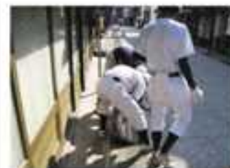
清掃ボランティア