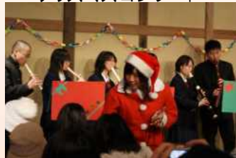
吹奏楽部による クリスマスコンサート