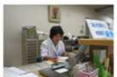
地元病院での職業体験