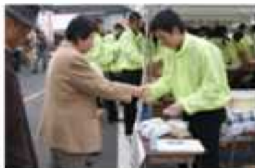
地域行事(秋祭り)での販売実習