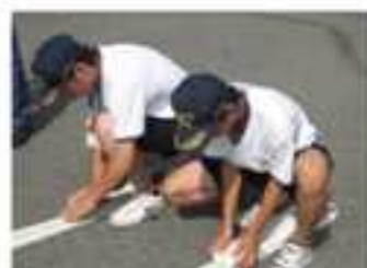
消防署での職業体験