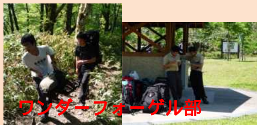
ワンダーフォーゲル部