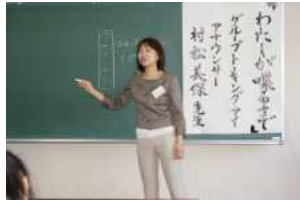
プロジェクトK ～仕事の達人～