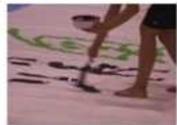
鼓山祭にて It's 書 time!