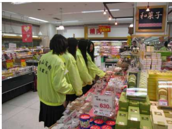
地元スーパーマーケットでの事業所見学

レジ打ちや商品陳列などの仕事が体験でき、将来の自分の進路選択に非常に役立つ時間を過ごせた。 レジ打ちの作業は意外と難しく、普段は客として反対の立場であったので不思議な感じがした。