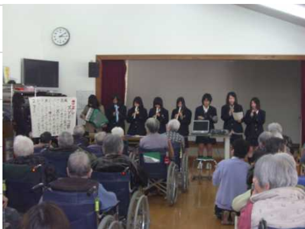
神庭荘でのアトラクションの様子

家庭科の授業の一環として、施設利用者 앞에서演奏や劇などの出し物を披露したり・・・。