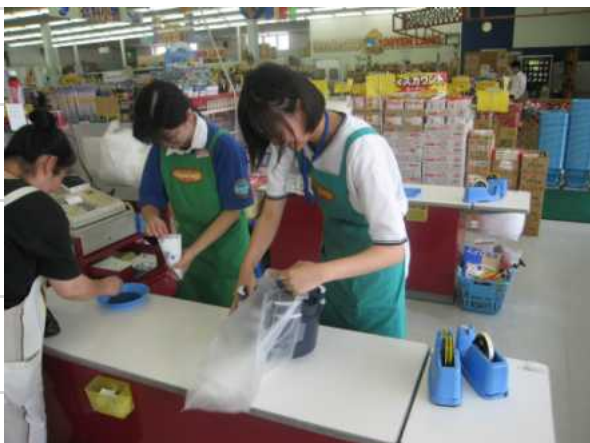
地元スーパーマーケットでのインターンシップ (職業体験)

レジ打ちや商品陳列などの仕事が体験でき、将来の自分の進路選択に非常に役立つ時間を過ごせた。 レジ打ちの作業は意外と難しく、普段は客として反対の立場であったので不思議な感じがした。